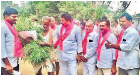
ఖాజీపేట్ గ్రామంలో కారు గుర్తుకు ఓటు వేయాలని రైతును కోరుతున్న బీఆర్ఎస్ శ్రేణులు