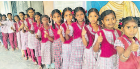
చిలిపిచెడ్ : చిట్టుల్ ఓటు వేసేందుకు క్యూలో ఉన్న విద్యార్థులు