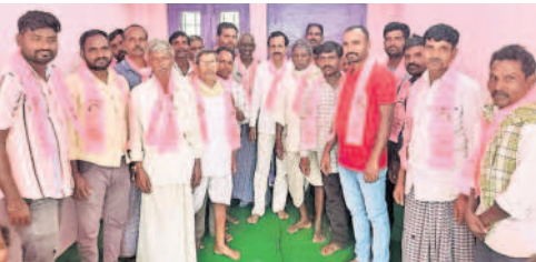
ప్రగతి ధర్మారం ఎన్నికల ప్రచారంలో పాల్గొన్న బీఆర్ఎస్ శ్రేణులు