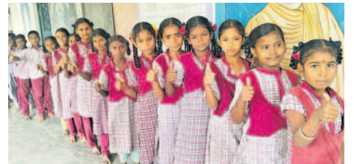
చిలిపిచెడ : చిట్టుల్ ఓటు వేసేందుకు క్యూలో ఉన్న విద్యార్థులు