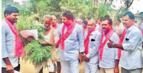
ఖాజీపేట్ గ్రామంలో కారు గుర్తుకు ఓటు వేయాలని రైతును కోరుతున్న బీఆర్ఎస్ శ్రేణులు