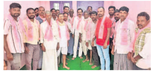
ప్రగతి ధర్మారం ఎన్నికల ప్రచారంలో పాల్గొన్న బీఆర్ఎస్ శ్రేణులు