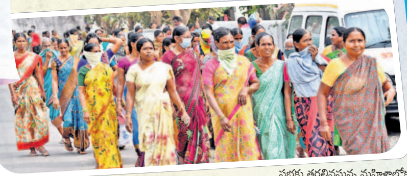
సభకు తరలివస్తున్న మహిళాలోకం..

ఈ జిల్లాలో ఇద్దరు.. ముగ్గురు మోపయ్యారు. ఒకడైతే పకాత్ పేకాట కబ్బులు పెట్టి పైనలు మందినెత్తికొట్టి సంపాదిస్తాడు. ఆ డబ్బులు తెచ్చి సీసాలు, అదీఇది పంచి గోల్ మాల్ చేస్తున్నారు. గోల్ మాల్ గోవిందం గాళ్లను ప్రజలు గోల్ మాల్ చేయనంత వరకు ఇదే దరిద్రం ఉంటుంది. ఈ దరిద్రాన్ని వదిలించుకోవాలి. ఆ శక్తి మీ చేతుల్లోనే ఉంటుంది. వాడు వచ్చి అడిగితే మొహమాటానికి ఆ అనాలే. సురుకుపెట్టే కాడ సురుకు పెట్టాలి.