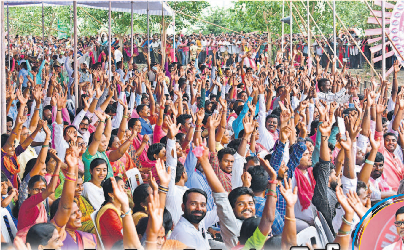
మంధని ప్రజా ఆశీర్వాద సభకు పోటెత్తిన జనం