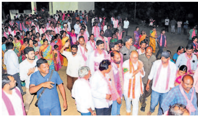
కాకతీయ కాలనీలో ఇంటింటా ప్రచారం చేస్తున్న గండ్ర