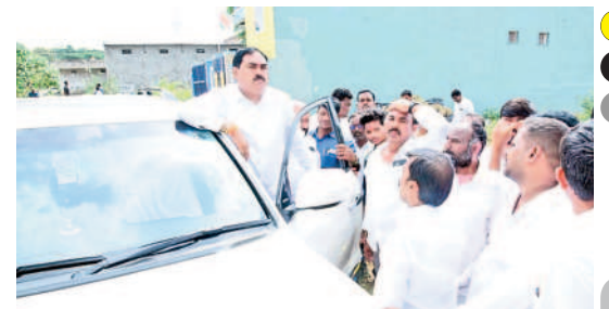
సభ ఏర్పాట్లపై స్థానిక నాయకులతో మాట్లాడుతున్న మంత్రి ఎర్రబెల్లి