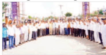
ఆత్మీయ సమ్మేళనానికి తరలివచ్చిన గొల్లకురుమలు

కడ్డాల, నవంబర్ 7: బీఆర్ఎస్ ప్రభుత్వం గొల్లకురుమల సంక్షేమానికి పెద్దపీట వేసిందని మండల గొల్లకాపరుల సంఘం నాయకులు అన్నారు. మంగళవారం ఆమనగల్లు పట్టణంలో నిర్వహించిన తాలూకా స్థాయి