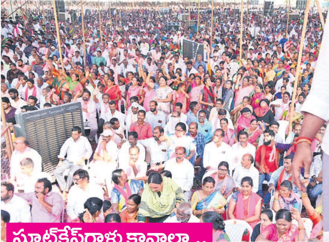
సూట్ కేసు గాళ్లు కావాలి..

సభా వేదికపై నమస్కరిస్తున్న సీఎం కేసీఆర్. పక్కన సుమన్