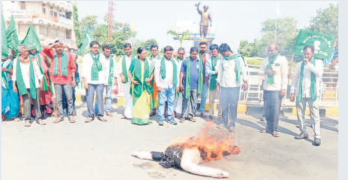
ఆదిలాబాద్ లో రేవంత్ రెడ్డి దిష్టిబొమ్మను దహనం చేస్తున్న తుడుండ్లెబ్బ నాయకులు