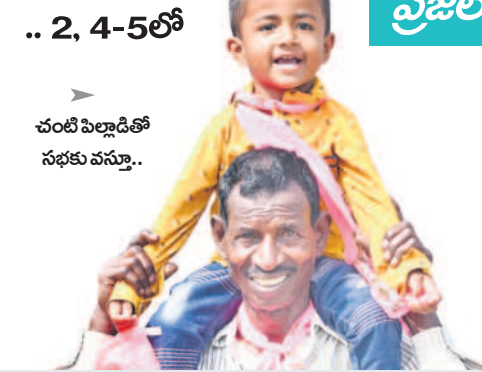
.. 2, 4-5లో చంటిపిల్లాడితో సభకు వస్తూ..