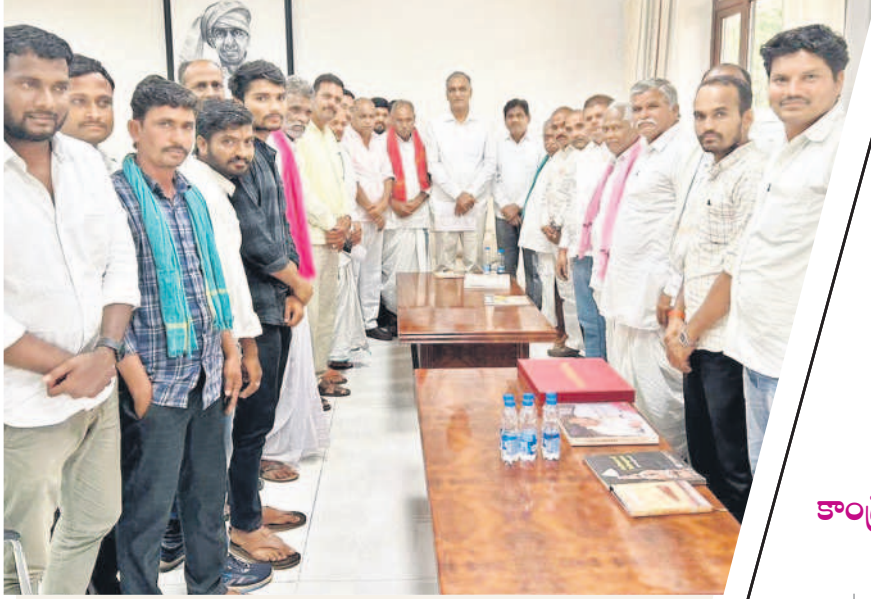
బీఆర్ఎస్ కు జైకొట్టిన లబానా లంబాడాలు కేసీఆర్ తోనే గిరిజనులకు న్యాయం.. నామినేషన్లు వేయబోమని ప్రకటన -3లో..