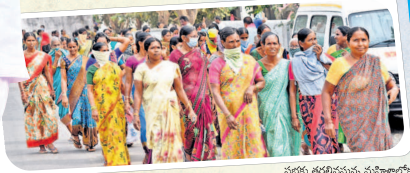
సభకు తరలివస్తున్న మహిళాలోకం..

ఈ జిల్లాలో ఇద్దరు.. ముగ్గురు మోపయ్యారు. ఒకడైతే పకాత్ పేకాట కబ్బులు పెట్టి పైనలు మందినెత్తికొట్టి సంపాదిస్తాడు. ఆ డబ్బులు తెచ్చి సీనాలు, అదీఇది పంచి గోల్ మాల్ చేస్తున్నారు. గోల్ మాల్ గోవిందం గాళ్లను ప్రజలు గోల్ మాల్ చేయనంత వరకు ఇదే దరిద్రం ఉంటుంది. ఈ దరిద్రాన్ని వదిలించుకోవాలి. ఆ శక్తి మీ చేతుల్లోనే ఉంటుంది. వాడు వచ్చి అడిగితే మొహమాటానికి ఆ అనాలే. సురుకుపెట్టే కాడ సురుకు పెట్టాలి.