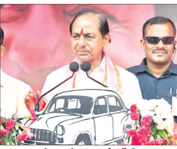
ప్రజా ఆశీర్వాద సభలో మాట్లాడుతున్న సీఎం కేసీఆర్