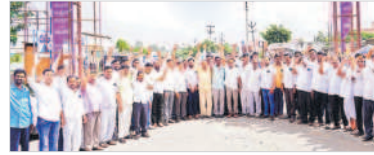
ఆత్మీయ సమ్మేళనానికి తరలివిన గొల్లకురుమలు

కడ్డాల, నవంబర్ 7: బీఆర్ఎస్ ప్రభుత్వం గొల్లకురుమల సంక్షేమానికి పెద్దపీట వేసేందుకు మండల గొల్లకాపరుల సంఘం నాయకులు అన్నారు. మంగళవారం ఆమనగల్లు పట్టణంలో నిర్వహించిన తాలూకా స్థాయి గొల్లకాపరుల ఆత్మీయ సమ్మేళనానికి, కడ్డాల