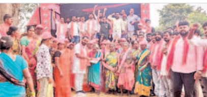
చెన్నంపల్లిలో బీఆర్ఎస్ నాయకుల ప్రచారం