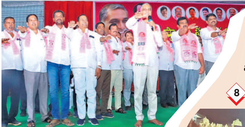
అందోల్: సమావేశానికి హాజరైన బూత్ లెవల్ నాయకులు, కార్యకర్తలతో క్రాంతికిరణ్ గెలిపించాలని ప్రతిజ్ఞ చేయిస్తున్న మంత్రి హరీశ్ రావు