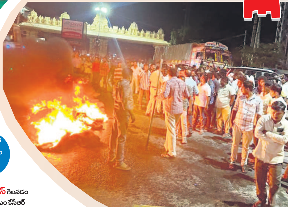
బిరంగూడలో అర్ధరాత్రి కాంగ్రెస్ కేటాయింపు విధ్వంసం