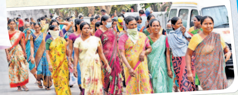
సభకు తరలివస్తున్న మహిళాలోకం..

ఈ జిల్లాలో ఇద్దరు.. ముగ్గురు మోహయ్యారు. ఒకడైతే పకాత్ పేకాట కబ్బులు పెట్టి పైసలు మందినెత్తికొట్టి సంపాదిస్తాడు. ఆ డబ్బులు తెచ్చి సీసాలు, అదీఇది పంచి గోల్ మాల్ చేస్తున్నారు. గోల్ మాల్ గోవిందం గాళ్లను ప్రజలు గోల్ మాల్ చేయనంత వరకు ఇదే దరిద్రం ఉంటుంది. ఈ దరిద్రాన్ని వదిలించుకోవాలి. ఆ శక్తి మీ చేతుల్లోనే ఉంటుంది. వాడు వచ్చి అడిగితే మొహమాటానికి ఆ అనాలే. సురుకుపెట్టే కాడ సురుకు పెట్టాలి.