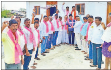
రాయికోడ్ : ప్రవారంలో భాగంగా కాంగ్రెస్ నాయకుడిని బీఆర్ఎస్ లోకి ఆహ్వానిస్తున్న బస్సరాజుపాటిల్