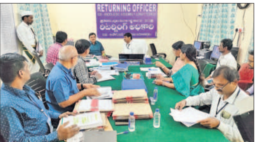
అందోల్ : అందోల్ రిటర్నింగ్ కార్యాలయంలో మాట్లాడుతున్న కలెక్టర్, రిటర్నింగ్ అధికారి