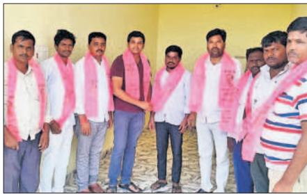
మనూరు : బీఆర్ఎస్ లో చేరుతున్న బీజేపీ సీనియర్ కార్యకర్తలు