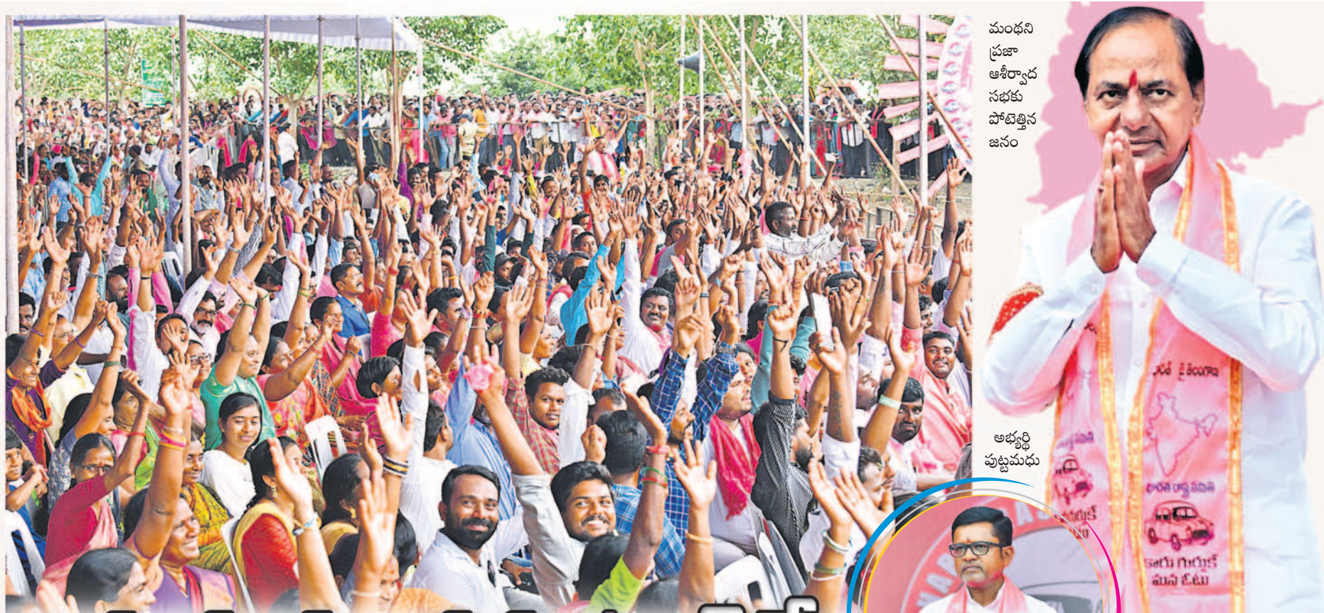
మంధని ప్రజా ఆశీర్వాద సభకు పోటెత్తిన జనం