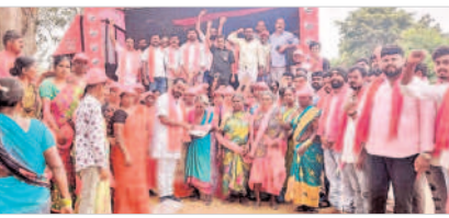
చెన్నంపల్లిలో బీఆర్ఎస్ నాయకుల ప్రచారం