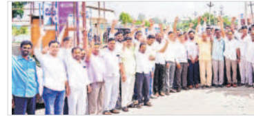
ఆత్మీయ సమ్మేళనానికి తరలుతున్న గొల్లకురుమలు

కడపలో, నవంబర్ 7: బీఆర్ఎస్ ప్రభుత్వం గొల్లకురుమల సంక్షేమానికి పెద్దపీట వేసింది మండల గౌరవ పురుల సంఘం నాయకులు అన్నారు. మంగళవారం ఆమనగల్లు పట్టణంలో నిర్వహించిన తాలూకా స్థాయి గౌరెలకాపరుల ఆత్మీయ సమ్మేళనానికి, కడపలో మండలం నుంచి గొల్లకురుమలు భారీగా తరలివెళ్లారు. ఈ సందర్భంగా మండల కేంద్రంలోని అంబే