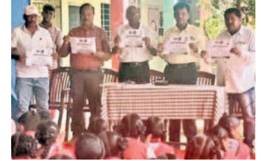
వాల్పోస్టర్ ఆవిష్కరిస్తున్న ఉపాధ్యాయులు