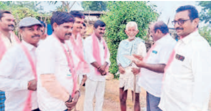
చిట్టూరు : చైన్ పాకలో జడ్పీటీసీ ప్రచారం