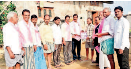
శాయంపేట : మైలారంలో నేతల ప్రచారం