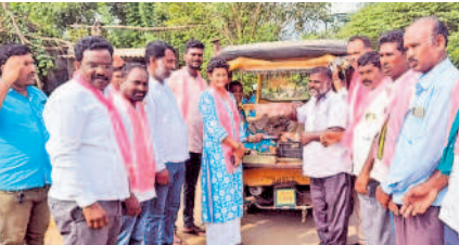
టీకుమట్ల: ప్రచారంలో బీఆర్ఎస్ నాయకులు