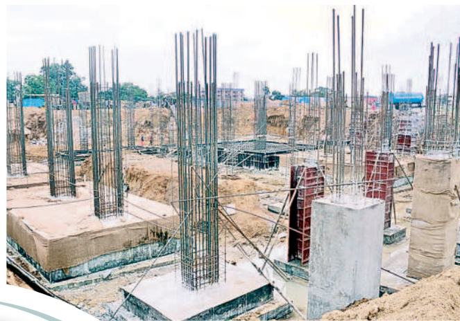
వరంగల్లో చకచకా సాగుతున్న ఐడీవోసీ నిర్మాణ పనులు