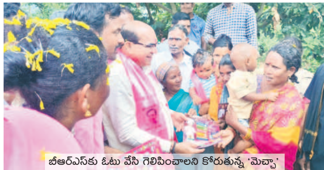
బీఆర్ఎస్ కు ఓటు వేసి గెలిపించాలని కోరుతున్న 'మెచ్చా'