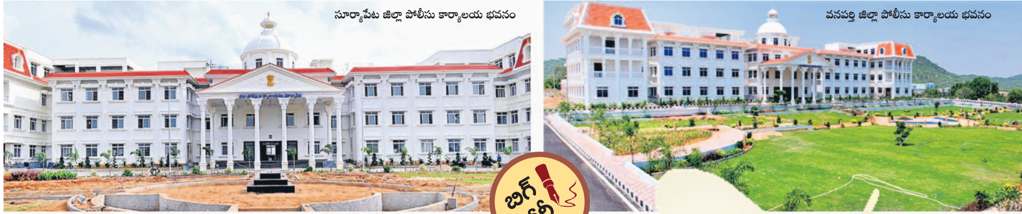
నూర్యాపేట జిల్లా పోలీసు కార్యాలయ భవనం

• సీఎం కేసీఆర్ అటు అసెంబ్లీకి, ఇటు పార్లమెంట్ రెండింటికి ప్రాతినిధ్యం వహించారు. సిద్దిపేట,