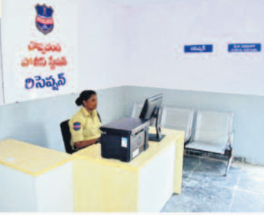
ఫిర్యాదుదారులకు లిసిప్లస్ సేవలు