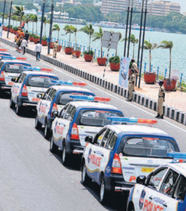
పోలీసుల కోసం కొత్త వాహనాలు