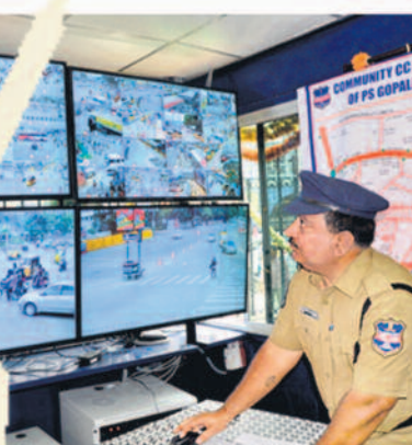
సీసీ కెమెరాల ద్వారా నిరంతర నిఘా

పోలీసుల సంక్షేమానికి రాష్ట్ర ప్రభుత్వం పెద్దపీట వేస్తున్నది. ట్రాఫిక్ అలవెన్స్, రిస్క్ అలవెన్స్ల కింద మూలవేతనంపై 30 శాతం పెంచింది. తెలంగాణ రాకముందు పోలీసులకు ఏడాదికోసారి ఇచ్చే యూనిఫాం అలవెన్స్ ఏ మూలకూ సరిపోయేది కాదు. స్వరాష్ట్రంలో 2018, ఫిబ్రవరి 20న యూనిఫాం అలవెన్స్ రూ.3,500 నుంచి రూ.7,500లకు పెంచారు. విడి నిర్వహణలో మరణిస్తే రూ.1.05 కోట్లు, విదుల్లో లేనప్పుడు మరణిస్తే రూ.90 లక్షలు, శాశ్వత అంగవైకల్యానికి గురైతే రూ.30 లక్షల ప్రమాద బీమాను అందిస్తున్నది. ఈ మేరకు గత జూలైలో బ్యాంక్ ఆఫ్ బరోడాతో ఒప్పందం కుదిరింది. హోంగార్టులను సైతం ప్రభుత్వం కడపలో పెట్టుకొని మూడుకుంటున్నది. 2014లో రూ.9 వేలూ ఉన్న హోంగార్టుల వేతనాన్ని రూ.17 వేలకు పెంచి.. ఇప్పుడు రూ.27 వేల గారవ వేతనం ఇస్తున్నది. ట్రాఫిక్ హోంగార్టులకు అలవెన్స్ లతో కలుపుకొని రూ.30 వేల పైనే జీతం అందుతున్నది. వీటికి తోడు యూనిఫాం అలవెన్స్ రూ.7,500, రూ.5 లక్షల ప్రమాద బీమా, మహిళా కాలస్ట్రబుల్తో సమానంగా మహిళా హోంగార్టులకు సౌకర్యాలు కల్పిస్తూ.. తెలంగాణ అగ్రస్థానంలో ఉంది.