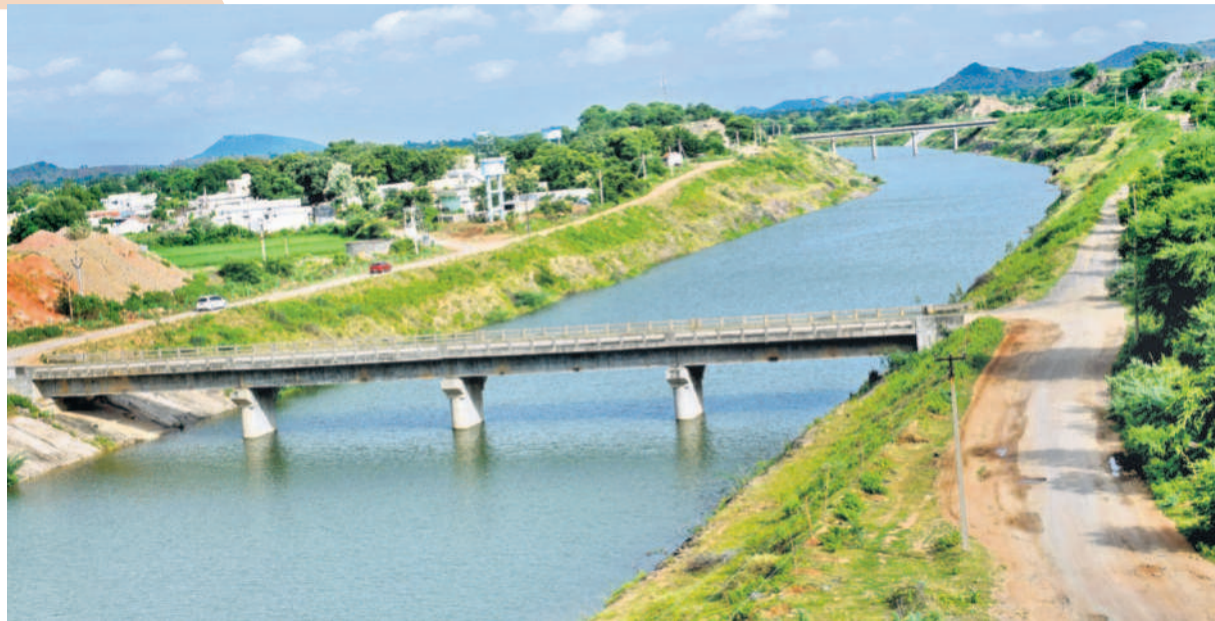
స్వరాష్ట్ర సాధన తర్వాత 2017లో ముఖ్యమంత్రి కేసీఆర్ ఎస్సార్ కేసీఆర్ పునరుజ్జీవ పథకాన్ని చేపట్టారు. రూ.1720 కోట్ల వ్యయంతో నిజామాబాద్ జిల్లా ముప్పాల్, జగిత్యాల జిల్లా మోట్పల్లి మండలం రాజేశ్వరరావుపేట, మల్కాపూర్ మండలం రాంపూర్ దగ్గర పంపిణీకాన్సెలు నిర్మించి వరద కాలువను 6 బ్యాటెరింగ్ లిజియోయర్గా మార్చారు. ఒకప్పుడు చుక్కటిల్ బాడే తేనె వరద కాలువ నేడు ఏడాది పొడవునా జలకళతో గలగల నవ్వుడి వినిపిస్తున్నది.