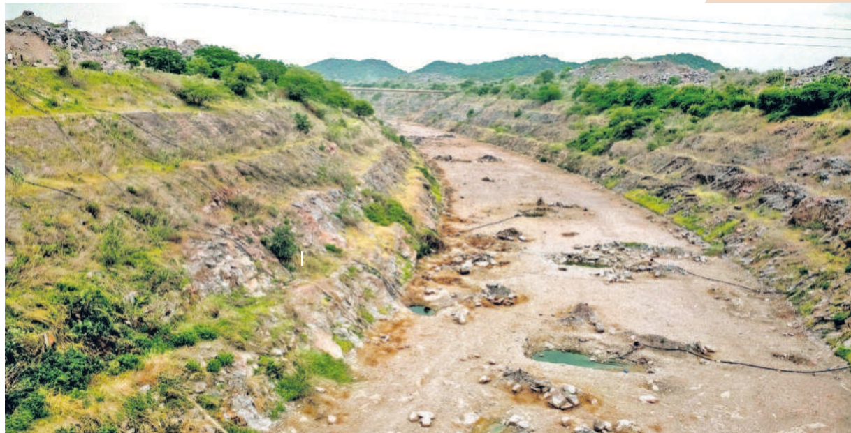
శ్రీరాంసాగర్ ప్రాజెక్టుకు వరద వచ్చిన సందర్భంలో నీటిని తరలించేందుకు 1991లో వరద కాలువ నిర్మాణానికి శ్రీకారం చుట్టారు. 122 కిలోమీటర్ల పొడవు 22,500 క్యూసెక్కుల నీటి ప్రవాహం సామర్థ్యంతో మొదలుపెట్టిన కాలువ సత్తనడకన సాగుతూ, ఎట్టకేలకు 2007 నాటికి పూర్తయ్యింది. ఎస్సార్ కేసీఆర్ పట్టించుకునే నాథుడు లేకపోవడంతో వరద కాలువ వట్టిపోయింది. నిజామాబాద్, కరంసాగర్ జిల్లాల రైతులకు దశాబ్దాల తరబడి సాగునీటి గోస తప్పలేదు.