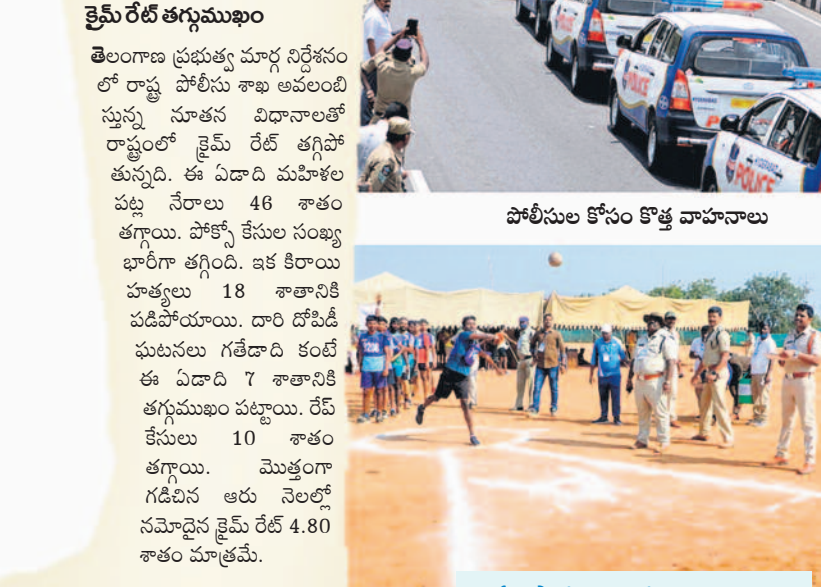
పోలీసుల కోసం కొత్త వాహనాలు

పోలీసుల సంక్షేమానికి రాష్ట్ర ప్రభుత్వం పెద్దపీట వేస్తున్నది. ట్రాఫిక్ అలవెన్స్, రిస్క్ అలవెన్స్ల కింద మూలవేతనంపై 30 శాతం పెంచింది. తెలంగాణ రాకముందు పోలీసులకు ఏడాదికోసారి ఇచ్చే యూనిఫాం అలవెన్స్ ఏ మూలకూ సరిపోయేది కాదు. స్వరాష్ట్రంలో 2018, ఫిబ్రవరి 20న యూనిఫాం అలవెన్స్ రూ.3,500 నుంచి రూ.7,500లకు పెంచారు. విడి నిర్వహణలో మరణిస్తే రూ.1.05 కోట్లు, విదుల్లో లేనప్పుడు మరణిస్తే రూ.90 లక్షలు, శాశ్వత అంగవైకల్యానికి గురైతే రూ.80 లక్షలు, పాక్షిక అంగవైకల్యానికి గురైతే రూ.30 లక్షల ప్రమాద బీమాను అందిస్తున్నది. ఈ మేరకు గత జూలైలో బ్యాంక్ ఆఫ్ బరోడాతో ఒప్పందం కుదిరింది. హోంగార్టులను సైతం ప్రభుత్వం కడపలో పెట్టుకొని మూసుకుంటున్నది. 2014లో రూ.9 వేలూ ఉన్న హోంగార్టుల వేతనాన్ని రూ.17 వేలకు పెంచి.. ఇప్పుడు రూ.27 వేల గారవ వేతనం ఇస్తున్నది. ట్రాఫిక్ హోంగార్టులకు అలవెన్స్ లతో కలుపుకొని రూ.80 వేల పైనే జీతం అందుతున్నది. వీటికి తోడు యూనిఫాం అలవెన్స్ రూ.7,500, రూ.5 లక్షల ప్రమాద బీమా, మహిళా కాలస్ట్రబుల్తో సమానంగా మహిళా హోంగార్టులకు సౌకర్యాలు కల్పిస్తూ.. తెలంగాణ అగ్రస్థానంలో ఉంది.