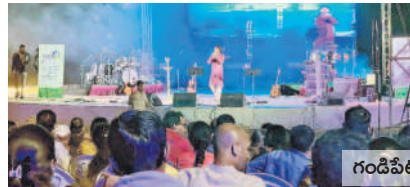
గండిపేట లేక్ వ్యూ పార్కులో నిర్వహించిన ప్రత్యేక సంగీత కచేరీ

గండిపేట పార్కులో సాంస్కృతిక కార్యక్రమాల నిర్వహణకు ప్రత్యేక వేదికను ఏర్పాటు చేశారు. ఒకేసారి 3వేల మంది వరకు కూర్చునేలా విశాలమైన ప్రాంగణంతో పాటు ఎత్తయిన వేదికను ఏర్పాటు చేశారు. పార్కు ప్రారంభమైన తర్వాత మొట్టమొదటి సారిగా పరంపర పేరుతో సంగీత కచేరీ కార్యక్రమాన్ని సాయంత్రం నిర్వహిస్తే సుమారు 2500 మంది వరకు కచేరీని ప్రత్యక్షంగా వీక్షించారని హెచ్ఎండిపి అధికారులు తెలిపారు.