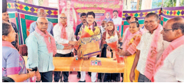
ఎమ్మెల్యే మాధవరంను సన్మానిస్తున్న గాయత్రినగర్ సీనియర్ సిటిజన్స్