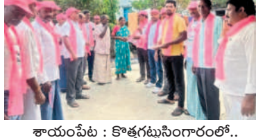
శాయంపేట : కొత్తగట్టుసింగారంలో..