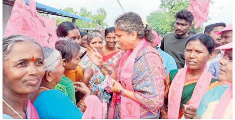
మహిళకు బొట్టు పెట్టి ఓటుడుగుతున్న గండ్ర జ్యోతి