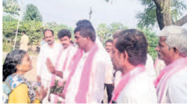
చిట్టూరు : కైలాశుర్లో జడ్పీటీసీ ప్రచారం