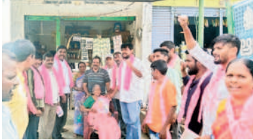
గణపురం చెల్వూర్లో శ్రేణుల ప్రచారం