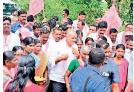
గండ్రకు స్వాగతం పలుకుతున్న ప్రజలు, నాయకులు

జిల్లాలు, మండలాలను ఏర్పాటు చేసినట్లు చెప్పారు. జెండా, ఎజెండా లేని నాయకులు చెప్పే కల్లబొల్లి మాటలను ప్రజలు నమ్మి మోసపోవద్దని చెప్పారు. మామూలులు చెప్పడం కాదని, ప్రజలకు ప్రతి పక్షాలు ఏం చేశాయో వివరించాలన్నారు. కాంగ్రెస్కు ఓటు వేస్తే కటిక బీకట్లోకి వెళ్లడం భాయమని, బీఆర్ఎస్కు ఓట్లనే రైతులకు నాణ్యమైన విద్యుత్ అందుతుందన్నారు. కాంగ్రెస్ ఆరు గ్యారెంటీల పేరుతో గ్రామాల్లో తిరుగు తున్న వారిని ప్రజలు ప్రశ్నించాలని, ఆ పార్టీ పాలిత కర్ణాటకలో పరిస్థితి ఎలా ఉందో ఒక్కసారి అలోచించాలన్నారు. కాంగ్రెస్ ప్రభుత్వం ఇస్తానన్న 3 గంటల కరెంట్ కావాలా? బీఆర్ఎస్ ప్రభుత్వం అందజేస్తున్న 24 గంటల కరెంట్ కావాలా? రైతులు ఆలోచించాలన్నారు. రైతుల శ్రేయస్సు కోసం రైతుబంధు, రైతు బీమా వంటి పథకాలను కల్పించడమే కాకుండా రానున్న రోజుల్లో తెలంగాణ కార్డ్ ఉన్న ప్రతి కుటుంబానికీ రూ. 5 లక్షల