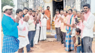
టేకుమట్ల : పూజలు చేస్తున్న నాయకులు