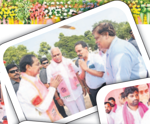
సీఎం కేసీఆర్ తో మాట్లాడుతున్న సిర్పూర్ పేపర్ మిల్లు ప్రతినిధులు