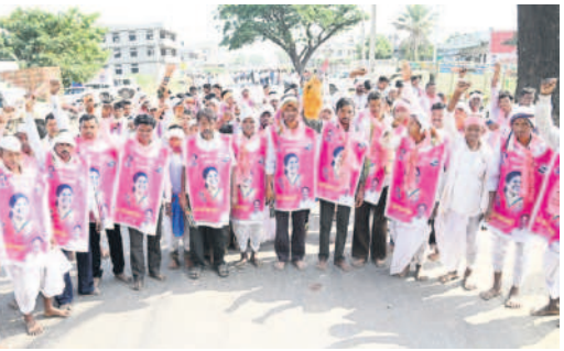
ఆసిఫాబాద్ : సీఎం కేసీఆర్, జడ్పీ చైర్మన్ కోవలక్ష్మి ఫాలోలతో తయారు చేసిన ఫ్లెక్సీలు ధరించి ఆసిఫాబాద్ కు వస్తున్న మహారాష్ట్ర వాసులు