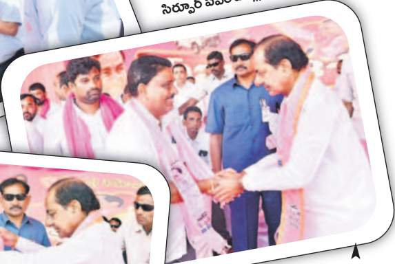
సీఎం కేసీఆర్ సమక్షంలో బీఆర్ఎస్ లో చేరుతున్న ఎంపీపీ వి యూ నాయకుడు సబ్బని కృష్ణ