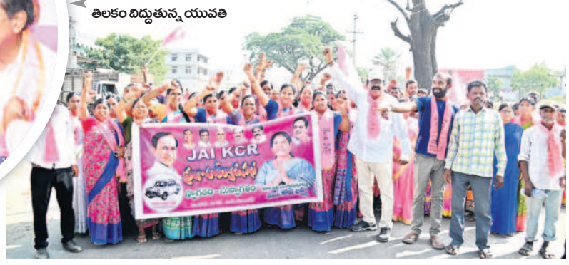
ఆసిఫాబాద్ : ప్రజా ఆశీర్వాద సభకు నివాదాలు చేస్తూ కదిలివస్తున్న మహిళలు