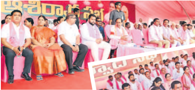
ఆసిఫాబాద్ : ముఖ్యమంత్రి కేసీఆర్, సిర్పూర్ మున్సిపల్ చైర్మన్ సర్దాం హాస్సినీ, నాయకులు