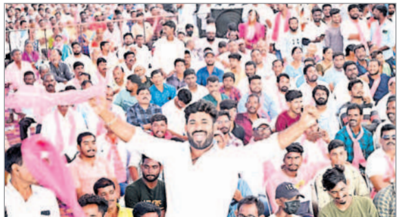
సీం కేసీఆర్ ప్రసంగిస్తుండగా యువకుల కేరితలు