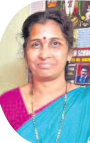
- దేశపాగ శోభ, కంటివైంట్

తెలంగాణ ఏర్పడక ముందు మంచినీళ్ల కోసం రోజంతా పడిగాపులు కాసేది. పండకోళ్ళ, పబ్బానోకీ సుట్టాల్లింటికి పోదామంటే... నీళ్లు ఎప్పుడొస్తాయో అని బెంగపడేది. కండ్లకొట్టెలు తీసుకొని నీళ్ల కోసం ఎదురుచూచాల్సిన పరిస్థితి ఉండేది. వాళ్లు మా ఇంటికి వచ్చినా నీళ్లు సరిపోక ఇబ్బంది ఉండేది. ఇగ దావతేలు చేసుకున్నప్పుడు నీటి తీవ్ర లోటు గురించి చెప్పనక్కర్లేదు. తెలంగాణ పచ్చని తర్వాత సీఎం కేసీఆర్ హయాంలో నీటికోసం తీరింది. ఇప్పుడు ప్రభుత్వం పుష్కలంగా నీటిని సరఫరా చేస్తున్నది. గోదావరి జలాలను హైదరాబాద్కు తీసుకొచ్చి తాగునీటిని అందిస్తున్నది. సార్వే మళ్ళా ఆదరించి అభివృద్ధి చేసే ఓటియ్యాలను కొరుతున్నది.