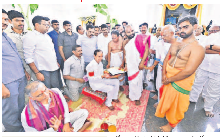
కోనాయిపల్లి వేంకటేశ్వర స్వామి ఆలయంలో పూజలు చేసిన అనంతరం సీఎం కేసీఆర్కు నామినేషన్ పత్రాలు అందజేస్తున్న అధ్యక్షులు

హుస్సేన్ సాహెబ్ మొదటి బహుళం సభ నిర్వహించిన తర్వాతనే ఎన్నికల ప్రచారానికి శ్రీకారం చుట్టడం సీఎం కేసీఆర్కు ఆసనాలు. అక్కడ మీటింగ్ అయ్యాకే ఆయన రాష్ట్ర మంతా పర్యటిస్తారు. 2014, 2018లో అక్కడ నుంచే సమర శంఖం పూరించారు. ఈ ఏడాది కూడా అక్కడే మొదటి సభ పెట్టారు. అలాగే సిద్దిపేట జిల్లా.. నంగుమారు మండలం.. కోనాయిపల్లిలో కొలువైన శ్రీ వేంకటేశ్వరస్వామివారిని దర్శనం చేసుకున్నాకే కేసీఆర్ నామినేషన్ దాఖలు చేస్తారు. రాజకీయం జీవితం ప్రారంభించిన నాటి నుంచే ఆయన ఈ సెంటిమెంట్ను ఫాలో అవుతున్నారు. కోనాయిపల్లి శ్రీ వేంకటేశ్వరస్వామివారి ఆశీస్సులతోనే లోకీ దిగి మీకేనా? ఎన్నికల పోరులో నిలిచే మాకూ కొన్ని సెంటిమెంట్లు ఉన్నాయంటున్నారు మన నేతలు. తామూ సెంటిమెంట్ ఫాలో అయ్యాకే కడన రంగంలోకి దిగుతామని వారు చెబుతున్నారు.