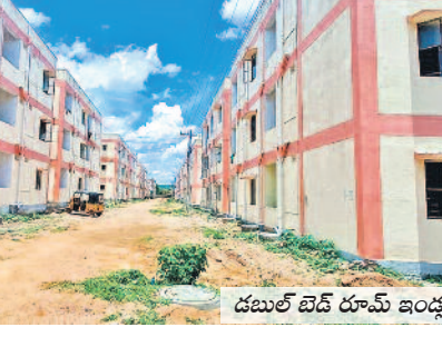
దబల్ బెడ్ రూమ్ ఇంట్లు

2022-23 సంవత్సరానికి 60,809 మంది రైతులకు రూ.88.17 కోట్ల రైతుబంధు సాయం అందించారు. రూ. 800 కోట్లతో అయిల్ పాను పరిశ్రమకు శంకుస్థాపన చేశారు. రూ.714 కోట్లతో ఏర్పాటు చేసిన లక్షీనరసింహ స్వామి ఎత్తిపోతలతో 50 వేల ఎకరాలకు సాగునీరు అందుతున్నది. రూ.896 కోట్లతో నిర్మల్ల పట్టణ సమగ్రాభివృద్ధి పనులు, రూ.166 కోట్లతో మెడకలో కళాశాల నిర్మాణం కొనసాగుతున్నది.