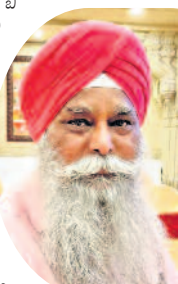
- సర్కార్ సరేందర్లం, అమీర్ ఫిఖ్ గురుద్వారా స్టేట్ సెక్టర్

మైనారిటీల సంక్షేమానికి చిత్తశుద్ధితో కృషిచేసిన నాయకుడు ముఖ్యమంత్రి కేసీఆర్. ప్రత్యేక రాష్ట్రం ఏర్పడితే అభివృద్ధి మందగిస్తుందని, శాంతిభద్రతల సమస్య తలెత్తుతుందని తప్పుడు ప్రచారం చేసి ప్రజలను ఇబ్బంది పరుచుకుంటున్నారని తెలంగాణ ఏర్పడిన తర్వాత బీఆర్ఎస్ ప్రభుత్వం పక్కన ఉండి నిర్ణయాలు తీసుకొన్నది. ప్రజలకు ఎలాంటి ఇబ్బందులు రాకుండా చర్యలు చేపట్టింది. హైదరాబాద్లో శాంతి, సామరస్యాన్ని కొనసాగించేందుకు కేసీఆర్ కనకణబద్ధుడై పనిచేస్తున్నారు. మైనారిటీల సంక్షేమమే కాకుండా ప్రజలందరి కోసం అనేక సంక్షేమ పథకాలు అమలు చేస్తున్నారు. షాద్ ముబారక్ ద్వారా అడవిదొడ్ల పెండ్లిళ్లకు సాయం అందిస్తున్నారు. టీ ప్రైవేట్ భాగంగా మైనారిటీ నిరుద్యోగ యువతకు వాహనాలు అందజేసి స్వయం ఉపాధి కల్పించిన మన తెలంగాణ ప్రభుత్వానిదే. దేశంలో ఏ రాష్ట్రంలో లేనివిధంగా ప్రజలకు అన్ని మౌలిక సదుపాయాలు కల్పించి తెలంగాణను ఆదర్శంగా తీర్చిదిద్దారు. హైదరాబాద్ను అత్యంత వేగంగా అభివృద్ధి చేస్తున్న సీఎం కేసీఆర్కు హక్కులేక విజయం అందించాలి. మళ్ళా కృషిని కారు గుర్తుకు ఓటికి ఆశీర్వాదించాలి.