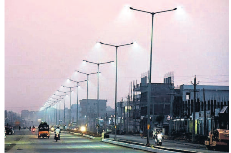
పట్టణంలో ఏర్పాటు చేసిన సెంట్రల్ లైటింగ్ సిస్టం

1952 సంవత్సరం నుంచి నిర్ణయ నియోజకవర్గ రాజకీయ ప్రస్థానం ప్రారంభమైంది. ఇప్పటివరకు 18 సార్లు ఎన్నికలు జరిగాయి. తెలంగాణ వచ్చాక కేసీఆర్ ప్రభుత్వం నూతన జిల్లాలు ఏర్పాటు చేయడంతో నిర్ణయ నియోజకవర్గం జిల్లా కేంద్రమయ్యింది. నర్సాపూర్ (జి), నిర్ణయ నిర్ణయ, సోన్, కొత్త మండలాల ఏర్పాటు. ఇటీవల పోస్టల్, టీలెవిజన్లను నూతన మండలాల జాబితాలో చేర్చారు.