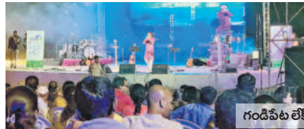
గండిపేట లేక్ వ్యూ పార్కులో నిర్వహించిన ప్రత్యేక సంగీత కచేరీ

గండిపేట పార్కులో సాంస్కృతిక కార్యక్రమాల నిర్వహణకు ప్రత్యేక వేదికను ఏర్పాటు చేశారు. ఒకేసారి 3వేల మంది వరకు కూర్చునేలా విశాలమైన ప్రాంగణంతో పాటు ఎత్తయిన వేదికను ఏర్పాటు చేశారు. పార్కు ప్రారంభమైన తర్వాత మొట్టమొదటి సారిగా పరంపర పేరుతో సంగీత కచేరీ కార్యక్రమాన్ని సాయంత్రం నిర్వహిస్తే సుమారు 2500 మంది వరకు కచేరీని ప్రత్యక్షంగా వీక్షించారని హెచ్ఎండ్ డి అధికారులు తెలిపారు.