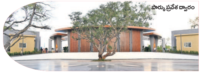
పార్కు ప్రవేశ ద్వారం