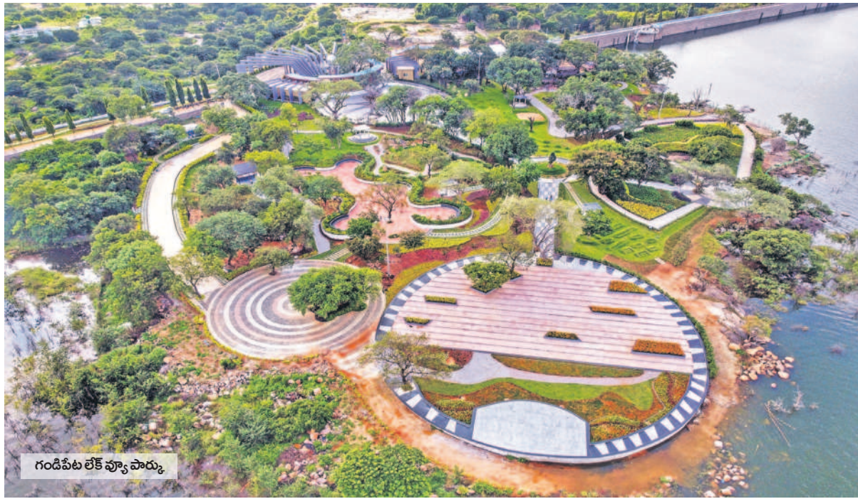
గండిపేట లేక్ వ్యూ పార్కు