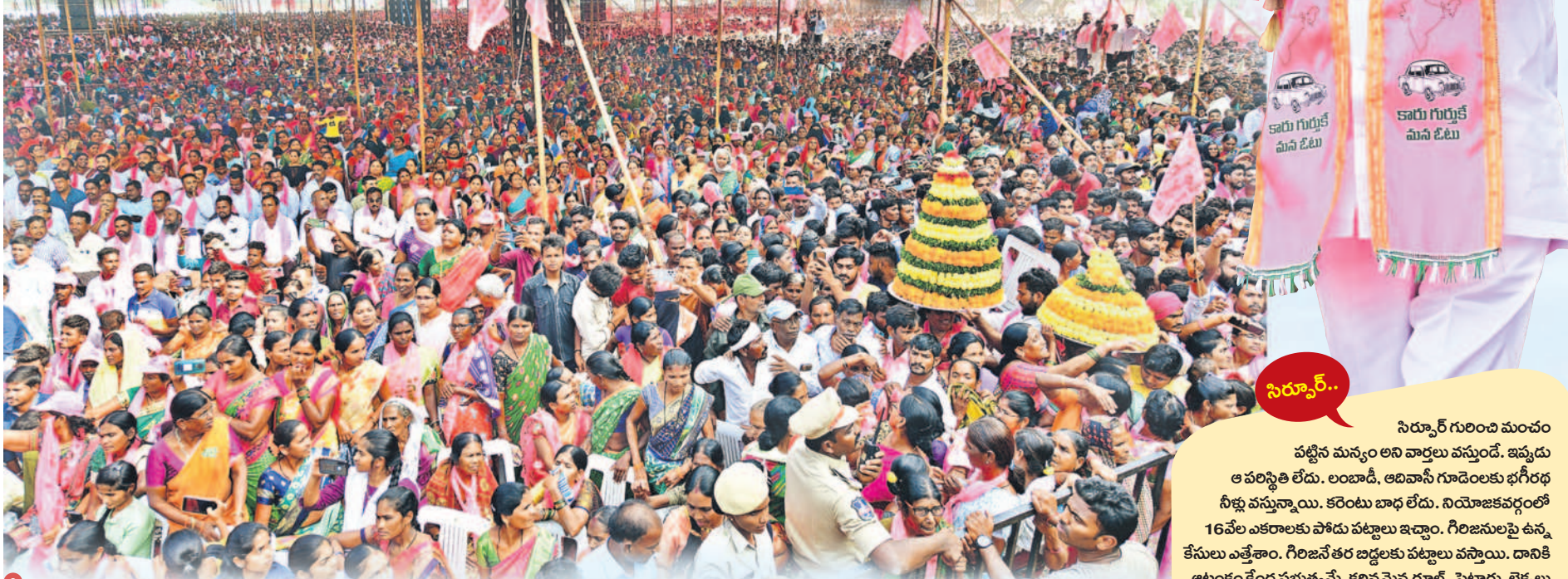
సిర్పూర్ ప్రజా ఆశీర్వాద సభకు హాజరైన ఆసీఆర్ జనం