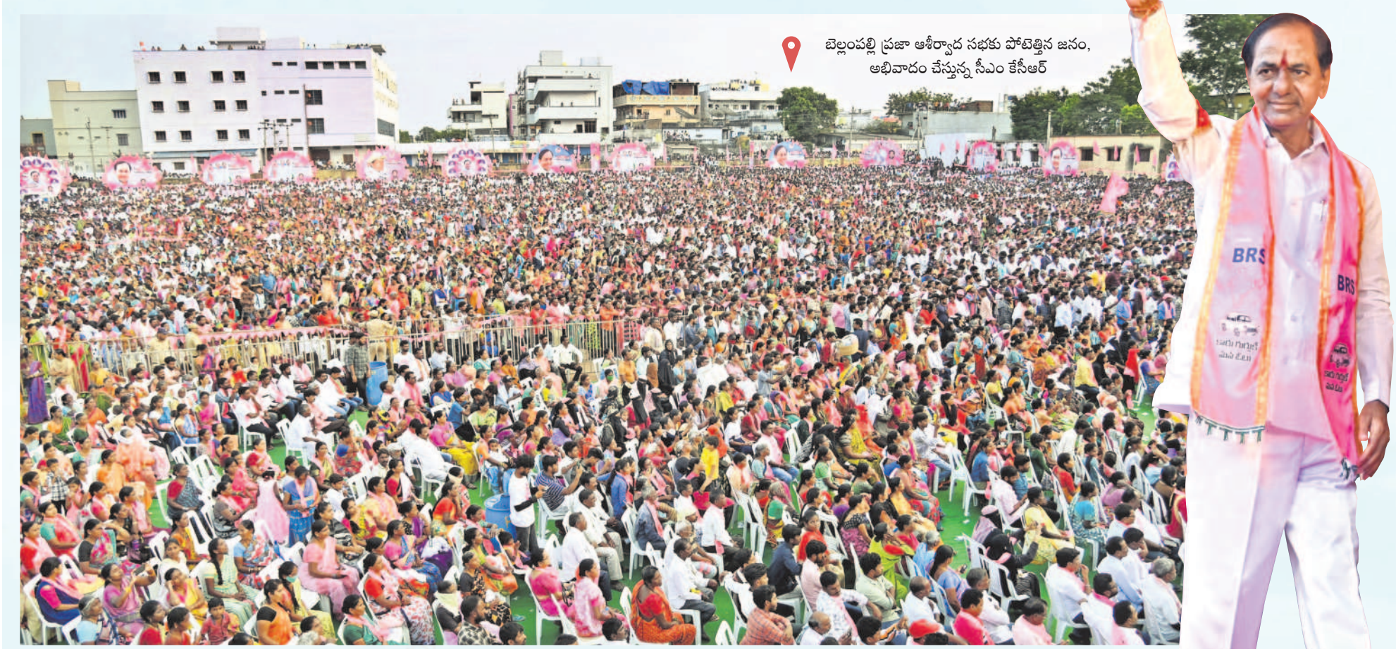
బెల్లంపల్లి ప్రజా ఆశీర్వాద సభకు పాల్గొన్న జనం, అభివాదం చేస్తున్న సీఎం కేసీఆర్