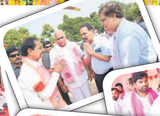
సీఎం కేసీఆర్ తో మాట్లాడుతున్న సిర్పూర్ పేపర్ మిల్లు ప్రతినిధులు