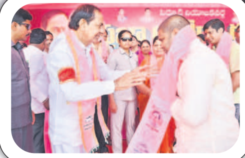
సీఎం కేసీఆర్ సమక్షంలో బీఆర్ఎస్ లో చేరుతున్న దివంగత మాజీ ఎమ్మెల్యే కావేటి సమ్మయ్య కుమారులు