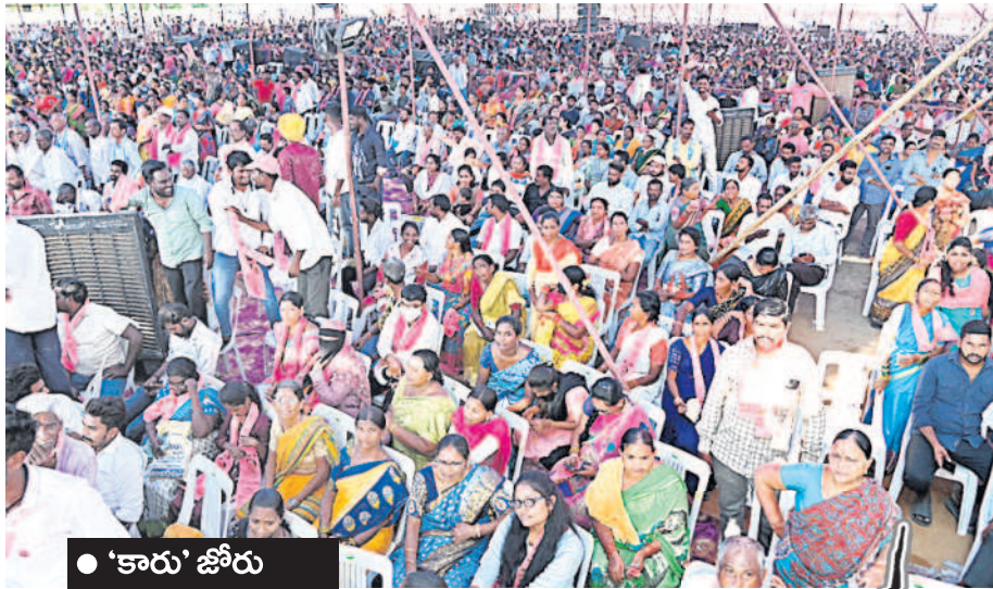
● 'కారు' జోరు