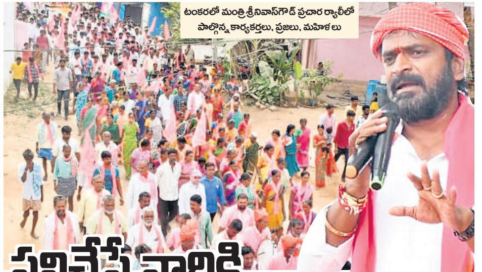
టంకరలో మంత్రి శ్రీనివాస్ గౌడ్ ప్రచార ర్యాలీలో పాల్గొన్న కార్యకర్తలు, ప్రజలు, మహిళలు