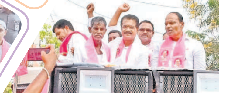
ఆచార్యపూర్ లో బీఆర్ఎస్ లో చేరిన వారికి గులాబీ కండువలు కప్పిస్తున్న ఎమ్మెల్యే రాజేందర్ రెడ్డి