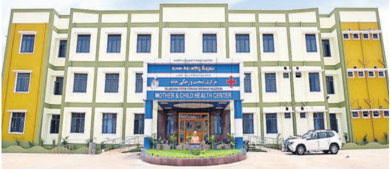
నల్లగొండ జిల్లా కేంద్రంలోని మాతా శిశు సంరక్షణ కేంద్రం

తెలంగాణ వైద్య రంగంలో విప్లవ వాత్యక మార్పులు