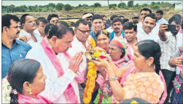
కట్టకింది తండాలో స్పీకర్ పోచారానికి మంగళ హారతులతో స్వాగతం పలుకుతున్న మహిళలు