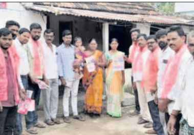
పాత వర్షిలో ప్రచారం చేస్తున్న బీఆర్ఎస్ నాయకులు