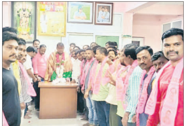
బాన్సువాడలో స్పీకర్ పోచారానికి ఏకగ్రీవ తీర్మాన పత్రాన్ని అందజేస్తున్న దుర్గి గ్రామానికి చెందిన పద్మశాలి సంఘం సభ్యులు

స్పీకర్ కు ఏకగ్రీవ తీర్మాన పత్రం అందజేసిన బాన్సువాడ స్వర్ణకారుల సంఘం సభ్యులు