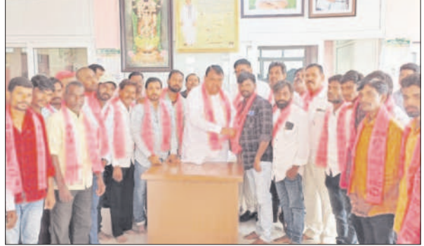
బీఆర్ఎస్లో చేరిన బీజేపీ కార్యకర్తలకు గులాబీ కండువా కప్పి పార్టీలోకి ఆహ్వానిస్తున్న స్పీకర్ పోచారం శ్రీనివాసరెడ్డి

గులాబీ కండువా కప్పి పార్టీలోకి ఆహ్వానించిన స్పీకర్ పోచారం శ్రీనివాసరెడ్డి