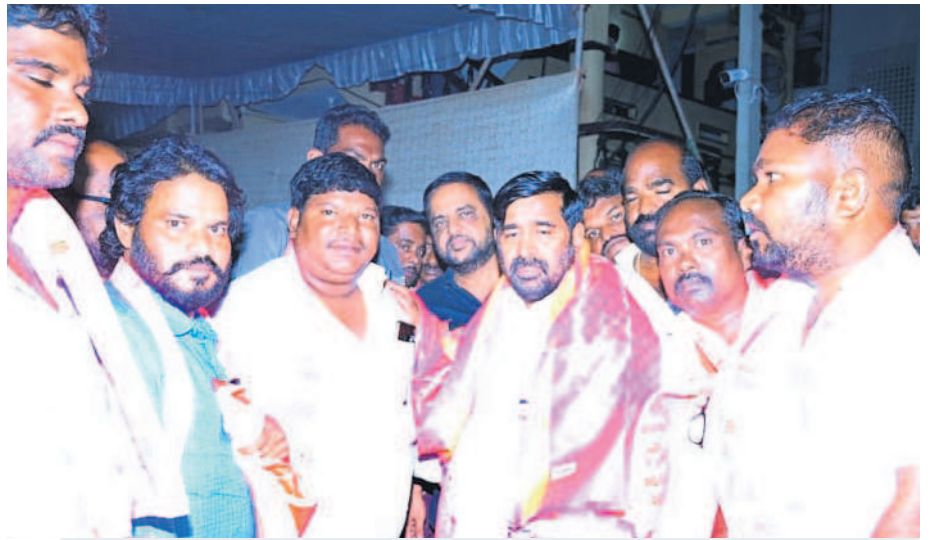
సూర్యాపేటలో కాంగ్రెస్, బీజేపీ నాయకులు, కార్యకర్తలకు గులాబీ కండువలు కప్పి బీఆర్ఎస్ లోకి ఆహ్వానిస్తున్న మంత్రి జగదీశ్ రెడ్డి