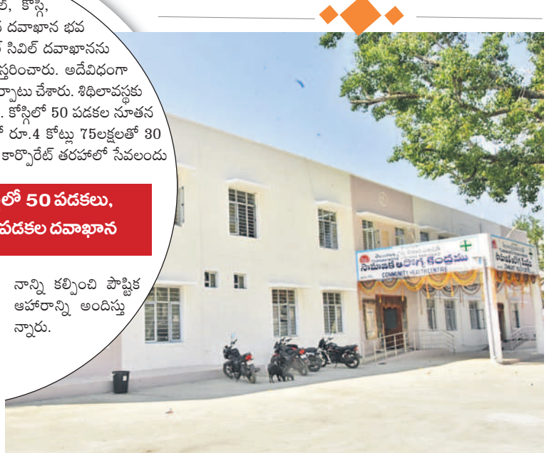
కోస్టిలోని 50 పడకల ప్రభుత్వ దవాఖాన