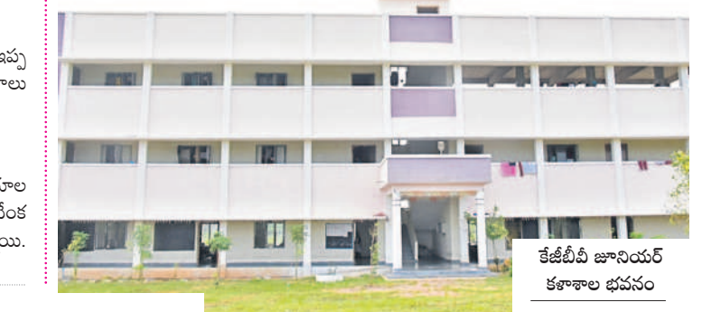
కేటీబీబీ జూనియర్ కళాశాల భవనం