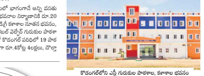
కొడంగల్లోని ఎస్సీ గురుకుల పాఠశాల, కళాశాల భవనం