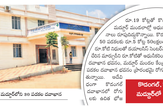
మద్దూర్లోని 30 పడకల దవాఖాన

రూ.19 కోట్లతో కొడంగల్, కోస్టి, మద్దూర్ మండలాలలో అధునాతన దవాఖాన భవనాలు రూపుదిద్దుకొన్నాయి. కొడంగల్ సివిల్ దవాఖానను 50 పడకలకు రూ.5 కోట్ల 50లక్షలతో విస్తరించారు. అదేవిధంగా రూ.కోటి నిధులతో డయాల్సిస్ సెంటర్ను ఏర్పాటు చేశారు. శిథిలావస్థకు చేరిన మార్బురీని రూ.కోటితో అద్దమీకరించారు. కోస్టిలో 50 పడకల నూతన దవాఖాన భవనం, మద్దూర్ మండల కేంద్రంలో రూ.4 కోట్లు 75లక్షలతో 30 పడకల దవాఖాన భవనం ప్రారంభమై రోగులకు కార్యోచిత తరహాలో సేవలందుతున్నాయి. అదేవిధంగా కొడంగల్ దవాఖానలో రోగులకు ఉచిత భోజనం