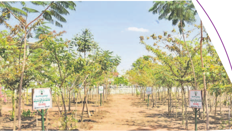
కొడంగల్లోని పట్టణంలోని ప్రకృతివనంలో ఏపూగా పెరిగిన మొక్కలు

పల్లె ప్రగతి కార్యక్రమంతో గ్రామాల రూపురేఖలు మారిపోయాయి. మున్సిపాలిటీలు, గ్రామాల్లో పట్టణ, పల్లె ప్రకృతి వనాలు, డంపింగ్ యార్డులు, వైకుంఠదామాలు, కంపోస్టు షెడ్ల నిర్మాణంతో స్వచ్ఛత ఏర్పడింది. రూ.400కోట్ల నిధులతో అన్ని గ్రామాలకు లింక్ రోడ్ల నిర్మాణం పూర్తింది. దీంతో ప్రజలు సాఫీగా ప్రయాణం చేయగలుగుతున్నారు. పారిశుధ్య నిర్వహణతో గ్రామాల స్వచ్ఛతకు మారుమేరగా మారాయి.