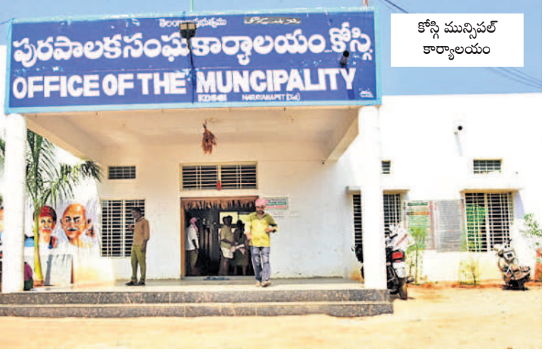
కోస్టి మున్సిపల్ కార్యాలయం

చెరువులకు పూర్వ వైభవాన్ని తీసుకొచ్చేందుకు ప్రభుత్వం మిషన్ భగీరథ కార్యక్రమాన్ని చేపట్టి చెరువులు, కుంటల పూడికతీత పనులు చేపట్టింది. కొడంగల్, బొంరాన్పేట్, దౌల్తాబాద్ మండలాల పరిధిలో ఇప్పటివరకు రూ.39 కోట్లతో 140 చెరువులు, కుంటల్లో 'మిషన్ కాకతీయ'లో పూడికతీత పనులు చేపట్టారు. దీంతో చెరువులు, కుంటల్లో నీటి నిల్వ సామర్థ్యం పెరిగింది. ప్రస్తుతం కొడంగల్లో 4708 ఎకరాలు, బొంరాన్పేట్లో 12,979, దౌల్తాబాద్లో 8,738, కోస్టిలో 16000, మద్దూర్ మండలంలో 14000 ఎకరాలు మొత్తంగా 56,425 ఎకరాల్లో పంటలు సాగువుతున్నాయి. కొడంగల్ పెద్దచెరువు సుందరీకరణకు ప్రభుత్వం రూ.కోటి 60 లక్షలు మంజూరు చేసింది. దౌల్తాబాద్ మండలంలోని చెరువులు రూ.7 కోట్ల 50లక్షలతో మినీ ట్యాంకెండ్లగా సుందరీకరిస్తున్నారు. నియోజకవర్గ పరిధిలో రూ.60 కోట్లతో 17 చెక్ డ్యాములను నిర్మించారు.