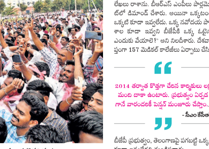
సిద్దిపేట జిల్లా గజ్వేల్ లో ముఖ్యమంత్రి కే చంద్రశేఖరరావును చూసేందుకు భారీగా తరలివచ్చిన ప్రజలు

గ్రెస్ పరిస్థితి. వచ్చిన తెలంగాణను కూడా బక కనియ్యవచ్చు. రాజకీయ అస్థిత్వం తేవాలని బీఆర్ఎస్ ఎమ్మెల్యేలను కొనే ప్రయత్నం చేసినందుకు అప్పుడు ఎవరెట్టే ఎమ్మెల్యేలను కొనడానికి