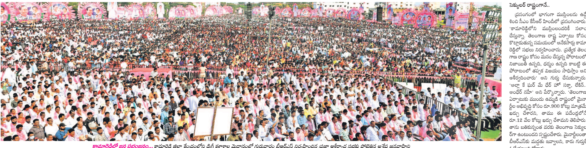
కామారెడ్డిలో జన ప్రభంజనం... కామారెడ్డి జిల్లా కేంద్రంలోని డిగ్రీ కళాశాల మైదానంలో గురువారం బీఆర్ఎస్ నిర్వహించిన ప్రజా ఆశీర్వాద సభలో పాల్గొన్న అనేక జనసాహిబు

రైతుల బాంబులకాడ మోటార్లకు మీటర్లు పెట్టాలని ప్రధాని మోడీ ఒత్తిడి తెచ్చినా 'నేను సర్వీసా పెట్టే' అని స్పష్టంగా చెప్పానని సీఎం కేసీఆర్ తెలిపారు. దీంతో ఏలూ రూ.50 లక్షలతో పట్టణాన్ని.. ఇప్పుడు ఆ మహాత్ముడే కామారెడ్డిలో నావై పోటీకి వస్తున్నా. మరే.. ఎవరికి ఏం బుద్ధి చెప్పారో మీరే నిర్ణయించండి' అని కేసీఆర్ కొరారు.