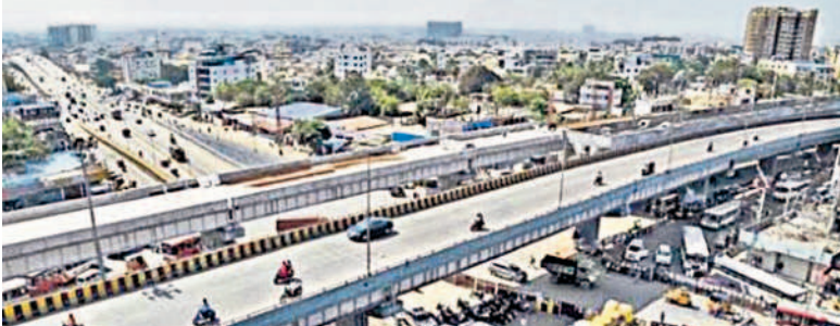
నూతనంగా వేసిన ఎల్ నగర్ రింగ్ రోడ్డు

ఎల్ నగర్, నవంబర్ 9 : ఎల్ నగర్ రింగ్ రోడ్డు చౌరస్తా ఈ పేరు గత దశాబ్దం క్రితం వింటే ట్రాఫిక్ రద్దీకి, చిక్కులకు కేంద్రం అని చెప్పేయవచ్చు. ఇన్వర్ రింగ్ రోడ్డుతో పాటుగా జాతీయ రహదారిని కలిపే చౌరస్తాగా, విజయవాడ జాతీయ రహదారిపై హైదరాబాద్ నగరానికి ముఖద్వారంగా ఉన్న ఎల్ నగర్ లో ట్రాఫిక్ చిక్కులు చూస్తే అంతా గందరగోళంగా ఉండేది. ఉమ్మడి ఏపీలో ఎల్ నగర్ చౌరస్తా వద్దకు రాగానే ఇన్వర్ రింగ్ రోడ్డుపై జాతీయ రహదారిపై ఇరువైపులా దాదాపు కిలోమీటర్ మేర వాహనాలు నిలిచిపోయి ఈ చౌరస్తా దాటాలంటే సుమారుగా అరగంట సమయం పట్టేది. ట్రాఫిక్ సిగ్నల్స్, ట్రాఫిక్ పోలీసుల ఊపిరి సలుపని విధులతో ఈ చౌరస్తా నిత్యం ఇబ్బందుల్లోనే ఉండేది. అదే రీతిలో ఇన్వర్ రింగ్ రోడ్డు పరిస్థితి కూడా దాదాపుగా ఇంతే పరిస్థితి. తెలంగాణ రాష్ట్రం ఏర్పడ్డాక రహదారుల నిర్మాణంలో భాగంగా ఎల్ నగర్ రింగ్ రోడ్డు చౌరస్తా విశ్వనగర హంగులు సంతరించుకుంది. జాతీయ రహదారిపై ఇరువైపులా ప్రయాణం కోసం రెండు పై ఓపర్ల నిర్మాణం, ఇన్వర్ రింగ్ రోడ్డులో ఇరువైపులా ప్రయాణించేందుకు రెండు అండర్ పాస్ నిర్మాణం జరగడంతో ప్రస్తుతం ఈ చౌరస్తాలో సెకన్లలో దాటేస్తూ అన్ని వాహనాలు సాఫీగా ప్రయాణం