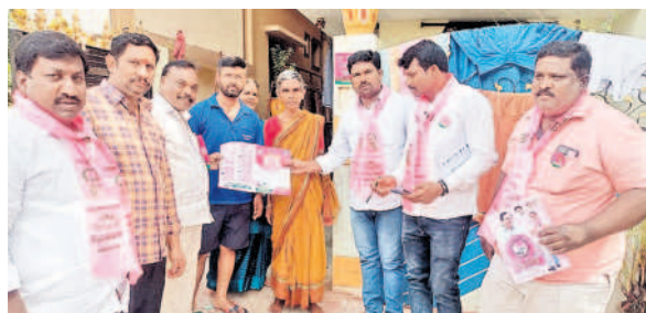
ఇంటింటి ప్రచారం చేస్తున్న డివిజన్ కార్యక విభాగం అధ్యక్షుడు సూరారపు జలంధర్