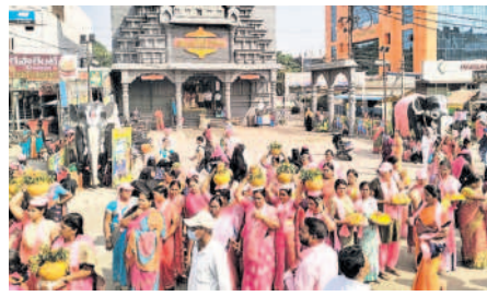
షాపూర్ నగర్ లో బోనాలు, బతుకమ్మలతో మహిళలు