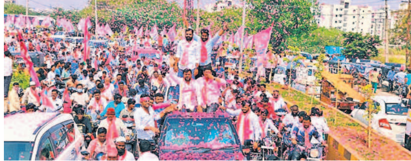
గండిమైసమ్మ చౌరస్తా నుంచి మహార్యాలీగా వస్తున్న బీఆర్ఎస్ శ్రేణులు