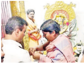
కట్టమైసమ్మ ఆలయంలో ఎమ్మెల్సీ పూజలు