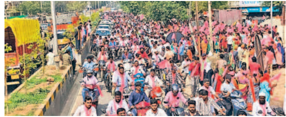
సూరారం నుంచి కుత్బుల్లాపూర్ సర్కిల్ వరకు ఎమ్మెల్సీ కేపీ వివేకానంద్ నామినేషన్ ర్యాలీలో భాగంగా టైక్ ర్యాలీ తీస్తున్న పార్టీ శ్రేణులు