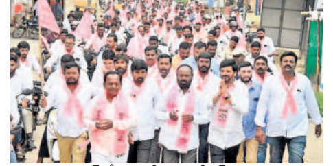
దుండిగల్ లో ఎమ్మెల్సీ నామినేషన్ కు సైన్స్ లా కదిలివస్తున్న ప్రజాప్రతినిధులు, పార్టీ శ్రేణులు