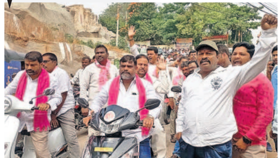
జగద్గిరిగుట్ట నుంచి టైక్ ర్యాలీతో వస్తున్న కార్పొరేటర్ జగన్ తదితరులు