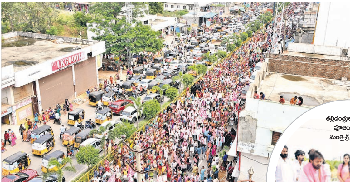
మహబూబ్ నగర్ జిల్లా కేంద్రంలో మంత్రి నామినేషన్ భారీగా హాజరైన జనం