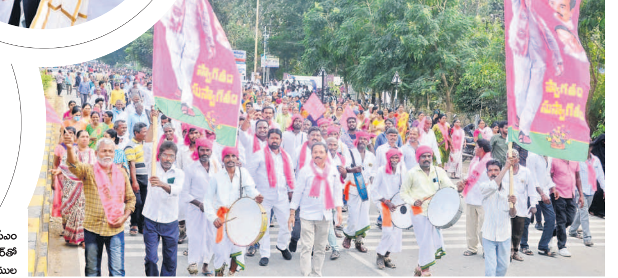
దప్పల దరువుతో..: దప్పలు కొడుతూ ర్యాలీగా వస్తున్న ప్రజానీకం