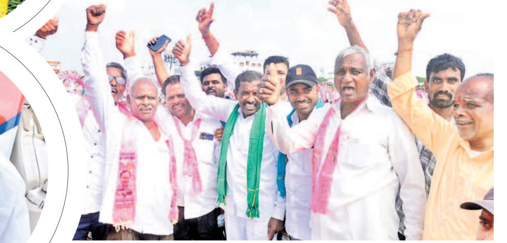
జై కేసీఆర్.. జయహో కేసీఆర్: సభా ప్రాంగణం వద్ద నివాదాలు చేస్తున్న రైతులు, యువకులు