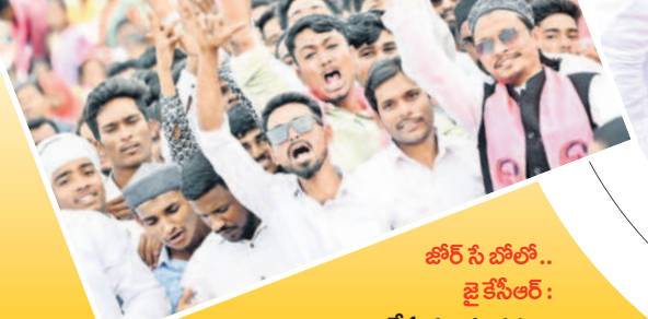
జోరేసి బోలో.. జై కేసీఆర్: నివాదాలు చేస్తున్న యువకులు