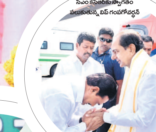
సీఎం కేసీఆర్ కు స్వాగతం పలుకుతున్న విప్ గంపగోవర్ధన్