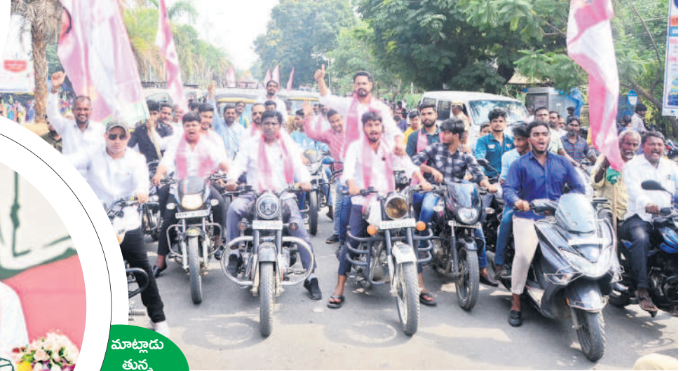
యువతరం మీ వెంటే.. బైక్ ర్యాలీగా వస్తున్న కామారెడ్డి నియోజకవర్గ యువకులు