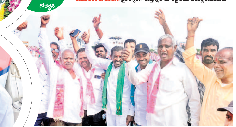
జై కేసీఆర్.. జయహో కేసీఆర్: సభా ప్రాంగణం వద్ద నినాదాలు చేస్తున్న రైతులు, యువకులు