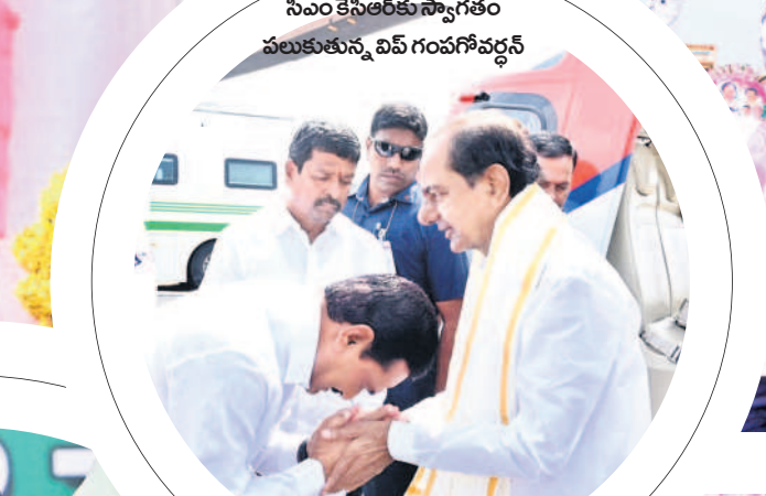
సీఎం కేసీఆర్ కు స్వాగతం పలుకుతున్న విప్ గంపగోవర్ధన్