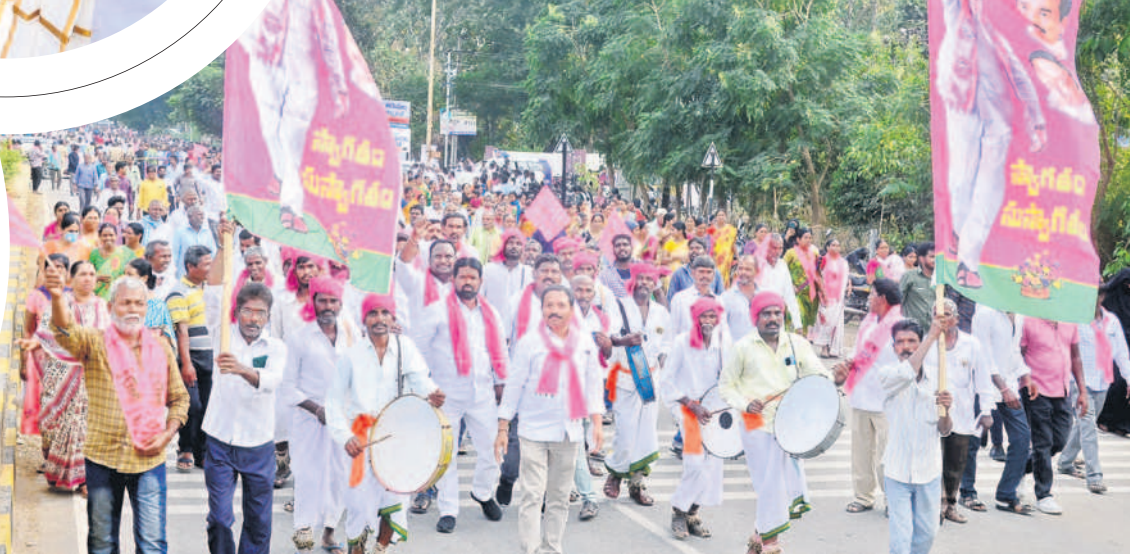
డప్పుల దరువుతో..: డప్పులు కొడుతూ ర్యాలీగా వస్తున్న ప్రజానీకం