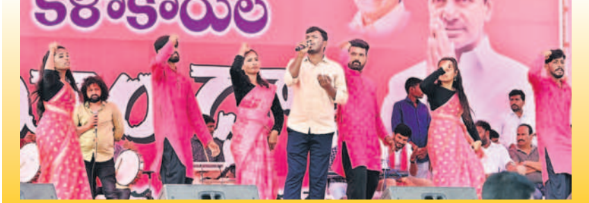
ధూంధూం: సభా ప్రాంగణంలో పాటలు పాడుతున్న కళాకారులు