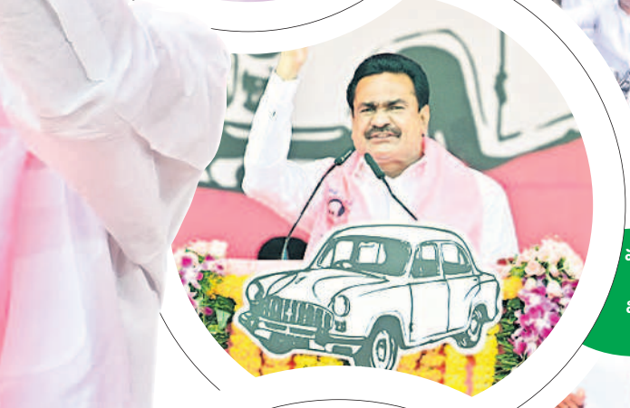
మూటాడు తున్న విప్ గంప గోవర్ధన్