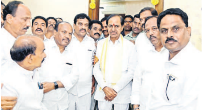
కామారెడ్డి నియోజకవర్గ బీఆర్ఎస్ నేతలతో సీఎం కేసీఆర్..