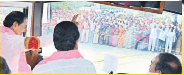
బస్సులో నుంచి ప్రజలకు అభివాదం చేస్తున్న సీఎం కేసీఆర్