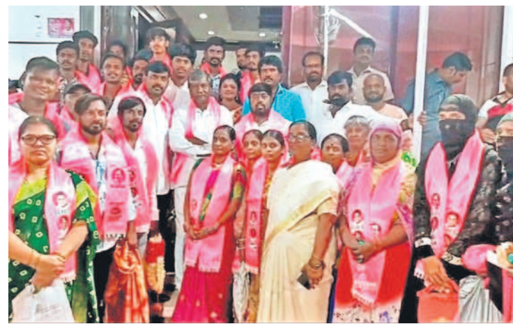
డిప్యూటీ స్పీకర్ పద్మారావు గౌడ్ సమక్షంలో పార్టీలో చేరిన కాంగ్రెస్ నాయకులు

అనంతరం, వారు మాట్లాడుతూ, సీఎం కేసీఆర్ తీసుకొచ్చిన సంక్షేమ పథకాలకు ఆకర్షితులై, అలాగే, సికింద్రాబాద్ నియోజకవర్గంలో పద్మారావు గౌడ్ చేసిన అభివృద్ధిని చూసి బీఆర్ఎస్ పార్టీలో చేరామని తెలిపారు. రేవంత్ రెడ్డి బహిరంగ సభ రోజే పార్టీకి గుడ్ బై పీసీసీ బీఐ రేవంత్ రెడ్డి బహిరంగ సభ రోజే.. అదే టైంలో సికింద్రాబాద్ లో 60 మంది కాంగ్రెస్ పార్టీ నాయకులు బీఆర్ఎస్ పార్టీలో చేరారు. దీంతో ఆ పార్టీకి నియోజకవర్గంలో అసమ్మతి ఎంత ఉందో అర్థం చేసుకోవచ్చు. కాంగ్రెస్ పార్టీకి సికింద్రాబాద్ లో వ్యతిరేకత చాలా ఉందని పార్టీ మారిన నాయకుల స్వయంగా చెబుతున్నారు. అలాగే, టీఆర్ఎస్ ఆశించిన మరో ఇద్దరు నాయకులు పార్టీకి, అభ్యర్థి ప్రచారానికి దూరంగా ఉంటున్నట్లు నాయకులు చర్చించుకుంటున్నారు.