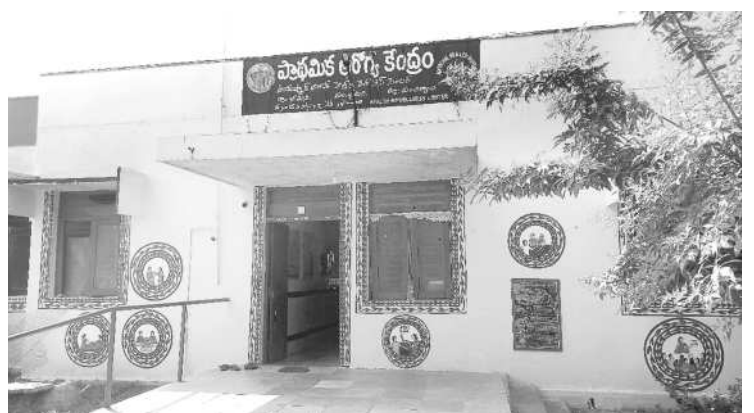
భీమినిలోని ప్రాథమిక ఆరోగ్య కేంద్రం

కిట్తో ప్రభుత్వ దవాఖానలో కాన్పుల కోసం వచ్చే వారి సంఖ్య పెరుగుతున్నది. సర్కారు దవాఖానలో కాన్పులు చేయించుకుంటే కేసీఆర్ కిట్తో పాటు బాలింతల ఖర్చు కోసం రూ. 12 వేలు ఇస్తుండడంతో మెరుగైన ఫలితాలు కనిపిస్తున్నాయి. అలాగే గర్భిణుల ఆరోగ్యం కోసం బీఆర్ఎస్ ప్రభుత్వం న్యూట్రీషన్ కిట్లు అందిస్తున్నది. అలాగే 9 నెలల పాటు గర్భిణులకు కావాల్సిన మందులను కూడా ప్రభుత్వం ఉచితంగా ఇస్తున్నది. అదే ప్రైవేటు దవాఖానలకు వెళ్లే లక్షల రూపాయల ఫీజులు వసూలు చేస్తుండడంతో గర్భిణులు ప్రభుత్వ దవాఖానాలకు వెళ్లి కాన్పు చేయించుకుంటున్నారు. అలాగే ప్రసవానికి దవాఖానకు వెళ్లే ముందు, ఆ తర్వాత కాన్పు అనంతరం ఇంటికి వచ్చేటప్పుడు అమ్మ ఒడి 102 వాహనాన్ని ఏర్పాటు చేస్తున్నారు.