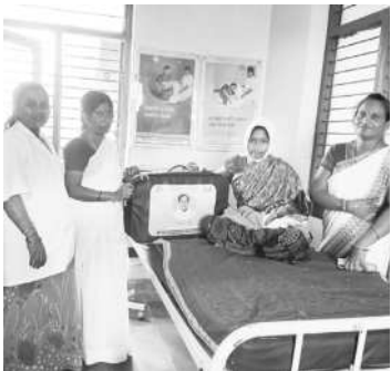
కేసీఆర్ కిట్ అందజేస్తున్న వైద్య సిబ్బంది

భీమిని, నవంబర్ 9: రాష్ట్రంలో వైద్యారోగ్య శాఖ తీసుకుంటున్న చర్యల్లో భాగంగా ప్రైవేటుకు దీటుగా ప్రభుత్వ దవాఖానాల్లో మెరుగైన వైద్య సేవలు అందుతున్నాయి. గతంలో సర్కారు దవాఖానాకు వెళ్లాలంటే రోగులు భయపడేవారు. స్వరాష్ట్రంలో ప్రభుత్వ దవాఖానాల్లో మెరుగైన సదుపాయాలు అందుబాటులోకి రావడంతో, ప్రజలంతా వైద్యం కోసం అక్కడికే వెళ్తున్నారు. బీఆర్ఎస్ ప్రభుత్వం అధికారంలోకి వచ్చిన తర్వాత ప్రైవేటు వద్దు.. ప్రభుత్వ దవాఖాన ముద్దు అనే స్థాయిలో మార్పు వచ్చింది. ఈ విధంగా వైద్యారోగ్య శాఖ ఎంత మెరుగైన సేవలను