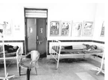
రక్షహీనత ఉన్న గర్భిణులకు ఐరన్ సుక్రోజ్ ఎక్కిస్తున్న దృశ్యం

కిట్తో ప్రభుత్వ దవాఖానలో కాన్పుల కోసం వచ్చే వారి సంఖ్య పెరుగుతున్నది. సర్కారు దవాఖానలో కాన్పులు చేయించుకుంటే కేసీఆర్ కిట్తో పాటు బాలింతల ఖర్చు కోసం రూ. 12 వేలు ఇస్తుండడంతో మెరుగైన ఫలితాలు కనిపిస్తున్నాయి. అలాగే గర్భిణుల ఆరోగ్యం కోసం బీఆర్ఎస్ ప్రభుత్వం న్యూట్రీషన్ కిట్లు అందిస్తున్నది. అలాగే 9 నెలల పాటు గర్భిణులకు కావాల్సిన మందులను కూడా ప్రభుత్వం ఉచితంగా ఇస్తున్నది. అదే ప్రైవేటు దవాఖానలకు వెళ్లే లక్షల రూపాయల ఫీజులు వసూలు చేస్తుండడంతో గర్భిణులు ప్రభుత్వ దవాఖానాలకు వెళ్లి కాన్పు చేయించుకుంటున్నారు. అలాగే ప్రసవానికి దవాఖానకు వెళ్లే ముందు, ఆ తర్వాత కాన్పు అనంతరం ఇంటికి వచ్చేటప్పుడు అమ్మ ఒడి 102 వాహనాన్ని ఏర్పాటు చేస్తున్నారు.