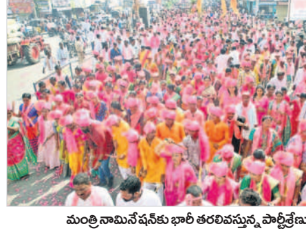
మంత్రి నామినేషన్ కు భారీ తరలివచ్చిన పార్టీ శ్రేణులు