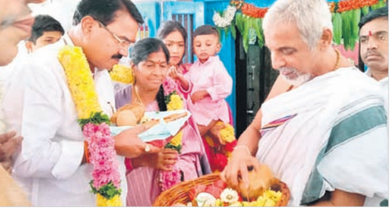
గట్టుకూడిపల్లి వేంకటేశ్వర ఆలయంలో పూజలు చేస్తున్న మంత్రి నిరంజన్ రెడ్డి