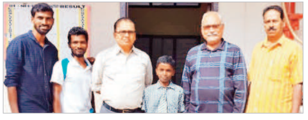
రాష్ట్రస్థాయి ఫుట్ బాల్ కు ఎంపికైన విద్యార్థితో పాఠశాల యాజమాన్యం