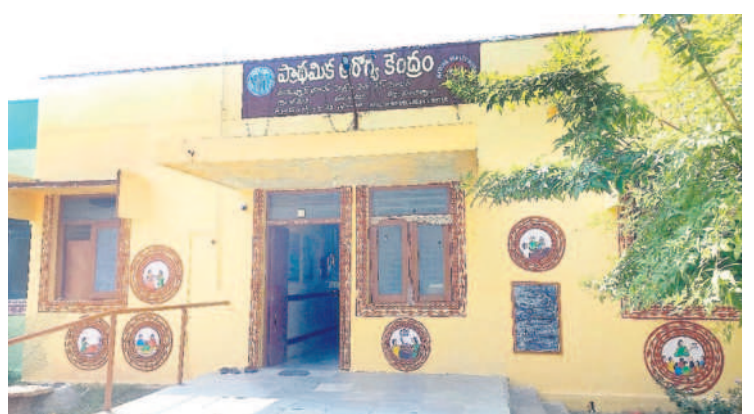
భీమినిలోని ప్రాథమిక ఆరోగ్య కేంద్రం

కిట్తో ప్రభుత్వ దవాఖానాలో కాన్పుల కోసం వచ్చే వారి సంఖ్య పెరుగుతున్నది. సర్కారు దవాఖానాలో కాన్పులు చేయించుకుంటే కేసీఆర్ కిట్తో పాటు బాలింతల ఖర్చు కోసం రూ. 12 వేలు ఇస్తుండడంతో మెరుగైన ఫలితాలు కనిపిస్తున్నాయి. అలాగే గర్భిణుల ఆరోగ్యం కోసం బీఆర్ఎస్ ప్రభుత్వం న్యూట్రీషన్ కిట్లు అందిస్తున్నది. అలాగే 9 నెలల పాటు గర్భిణులకు కావాల్సిన మందులను కూడా ప్రభుత్వం ఉచితంగా ఇస్తున్నది. అదే ప్రైవేటు దవాఖానాలకు వెళ్లే లక్షల రూపాయల షిజులు వసూలు చేస్తుండడంతో గర్భిణులు ప్రభుత్వ దవాఖానాలకు వెళ్లి కాన్పు చేయించుకుంటున్నారు. అలాగే ప్రసవానికి దవాఖానకు వెళ్లే ముందు, ఆ తర్వాత కాన్పు అనంతరం ఇంటికి వచ్చేటప్పుడు అమ్మ ఒడి 102 వాచానాన్ని ఏర్పాటు చేస్తున్నారు.