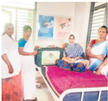
కేసీఆర్ కిట్ అందజేస్తున్న వైద్య సిబ్బంది

భీమిని, నవంబర్ 9: రాష్ట్రంలో వైద్యారోగ్య శాఖ తీసుకుంటున్న చర్యల్లో భాగంగా ప్రైవేటుకు దీటుగా ప్రభుత్వ దవాఖానాల్లో మెరుగైన వైద్య సేవలు అందుతున్నాయి. గతంలో సర్కారు దవాఖానాకు వెళ్లాలంటే రోగులు భయపడేవారు. స్వరాష్ట్రంలో ప్రభుత్వ దవాఖానాల్లో మెరుగైన సదుపాయాలు అందుబాటులోకి రావడంతో, ప్రజలంతా వైద్యం కోసం అక్కడికి వెళ్తున్నారు. బీఆర్ఎస్ ప్రభుత్వం అధికారంలోకి వచ్చిన తర్వాత 'ప్రైవేటు వద్దు.. ప్రభుత్వ దవాఖాన ముద్దు' అనే స్లోలో మార్పు వచ్చింది. ఈ విధంగా వైద్యారోగ్య శాఖ ఎంత మెరుగైన సేవలను