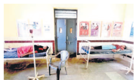
రక్షహీనత ఉన్న గర్భిణులకు ఐరన్ సుక్రోజ్ ఎక్సిస్టెన్షియల్ ద్రవ్యం

కిట్తో ప్రభుత్వ దవాఖానాలో కాన్పుల కోసం వచ్చే వారి సంఖ్య పెరుగుతున్నది. సర్కారు దవాఖానాలో కాన్పులు చేయించుకుంటే కేసీఆర్ కిట్తో పాటు బాలింతల ఖర్చు కోసం రూ. 12 వేలు ఇస్తుండడంతో మెరుగైన ఫలితాలు కనిపిస్తున్నాయి. అలాగే గర్భిణుల ఆరోగ్యం కోసం బీఆర్ఎస్ ప్రభుత్వం న్యూట్రీషన్ కిట్లు అందిస్తున్నది. అలాగే 9 నెలల పాటు గర్భిణులకు కావాల్సిన మందులను కూడా ప్రభుత్వం ఉచితంగా ఇస్తున్నది. అదే ప్రైవేటు దవాఖానాలకు వెళ్లే లక్షల రూపాయల షిజులు వసూలు చేస్తుండడంతో గర్భిణులు ప్రభుత్వ దవాఖానాలకు వెళ్లి కాన్పు చేయించుకుంటున్నారు. అలాగే ప్రసవానికి దవాఖానకు వెళ్లే ముందు, ఆ తర్వాత కాన్పు అనంతరం ఇంటికి వచ్చేటప్పుడు అమ్మ ఒడి 102 వాచానాన్ని ఏర్పాటు చేస్తున్నారు.