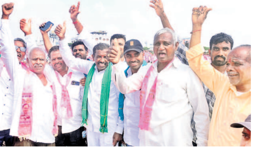
జై కేసీఆర్.. జయహో కేసీఆర్: సభా ప్రాంగణం వద్ద నివాదాలు చేస్తున్న రైతులు, యువకులు