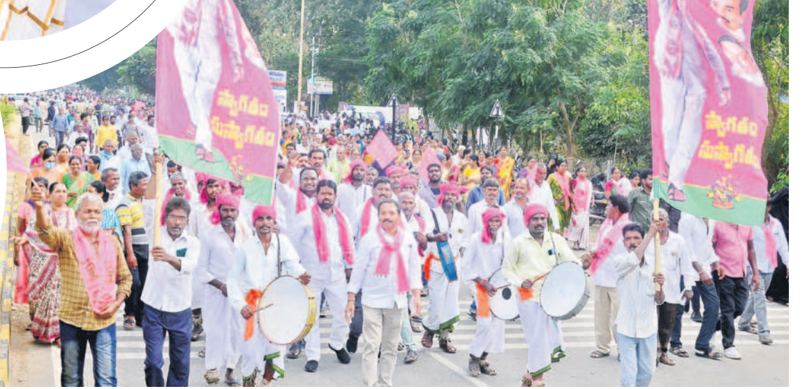
డప్పుల దరువుతో..: డప్పులు కొడుతూ ర్యాలీగా వస్తున్న ప్రజానీకం