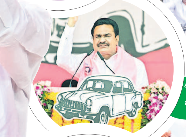
సీఎం కేసీఆర్ కు స్వాగతం పలుకుతున్న విప్ గంపగోవర్ధన్