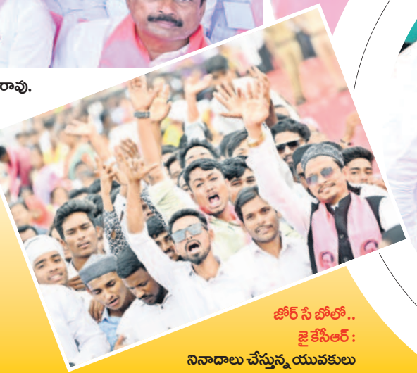
జోరే సీ బోలో.. జై కేసీఆర్: నివాదాలు చేస్తున్న యువకులు